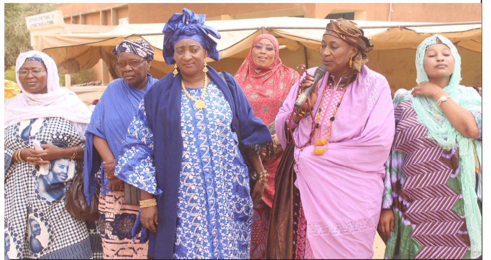
MADAME HALIMA TIOUSO ET LES FEMMES ENTREPRENEURES de Dosso

Avec son partenaire fidèle l'ONG ADESP, le service régional de la Promotion de la femme et de la protection de l'Enfant a accompagné les femmes leaders de la région de Dosso dans le cadre de la commémoration de la journée du 13 Mai, date historique célébrée chaque année pour ainsi rappeler les prouesses des femmes Nigériennes qui ont arraché en Novembre 1991 leur droit d'appartenir à des commissions de la conférence na-