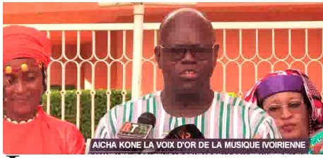
AÏCHA KONÉ LA VOIX D'OR DE LA MUSIQUE IVOIRIENNE