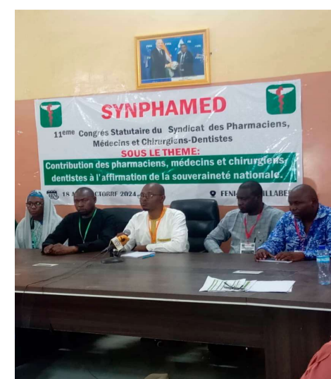
Ce nouveau bureau composé

Une nouvelle plateforme revendicative a été élaborée et un nouveau bureau mis en place composé d'une quinzaine de membres pour un mandat de 3 ans.